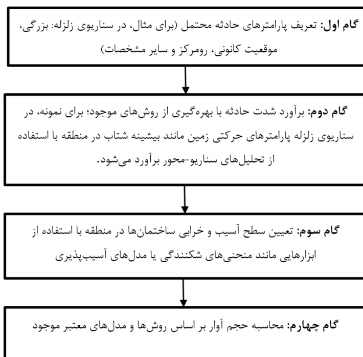
شکل ۱-۲: الگوریتم چهارمرحله‌ای تخمین حجم آوار ناشی از بلایای طبیعی

شکل ۱-۲، روند محاسباتی برآورد حجم آوار را به صورت مرحله‌به‌مرحله نمایش می‌دهد.